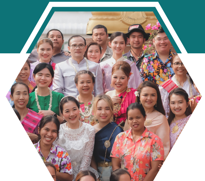
เจ้าหน้าที่มีความสุข