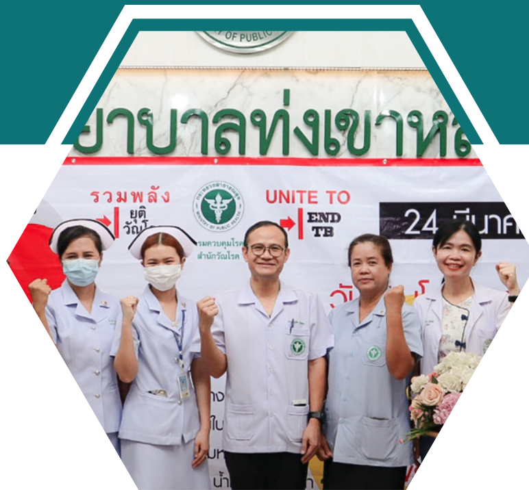
ประชาชนสุขภาพดี