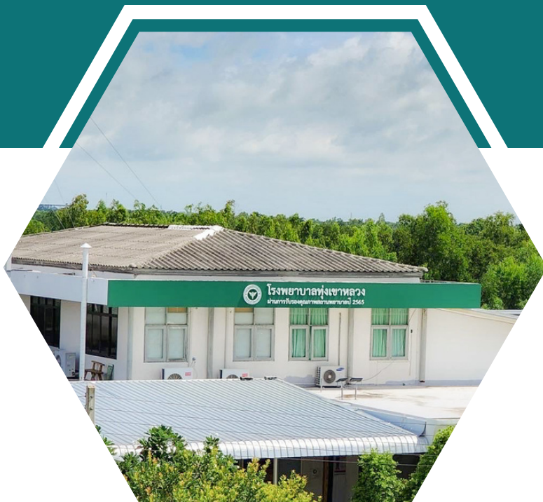
โรงพยาบาลมาตรฐานสากล